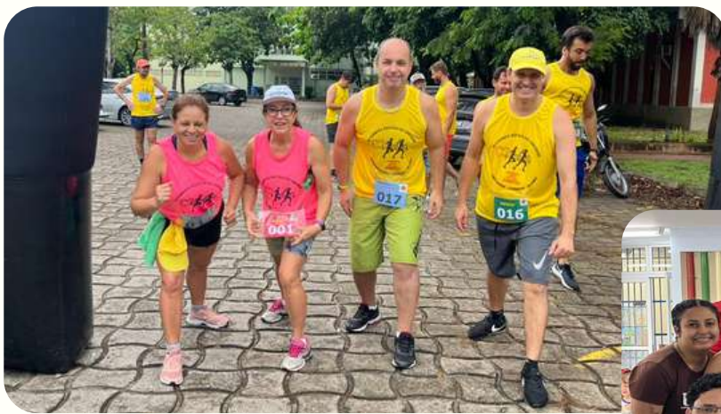
EQUIPE CRIARTE PARTICIPA DA “VI CORRIDA E CAMINHADA DOS SERVIDORES: CORRENDO ATRÁS DOS SEUS DIREITOS”

A Semana do Servidor na UFES é um evento anual que celebra e reconhece a dedicação e o comprometimento dos servidores que desempenham um papel fundamental no funcionamento da instituição. Durante essa semana especial, foram realizadas diversas atividades voltadas para o bem-estar, a capacitação e a integração dos servidores. Workshops, palestras motivacionais, sessões de relaxamento e momentos de confraternização foram organizados para fortalecer os laços entre os membros da comunidade universitária. A Semana do Servidor na UFES não apenas destaca a importância do trabalho árduo e dedicado dos servidores, mas também proporciona oportunidades valiosas para o aprendizado contínuo e o fortalecimento do espírito de equipe.