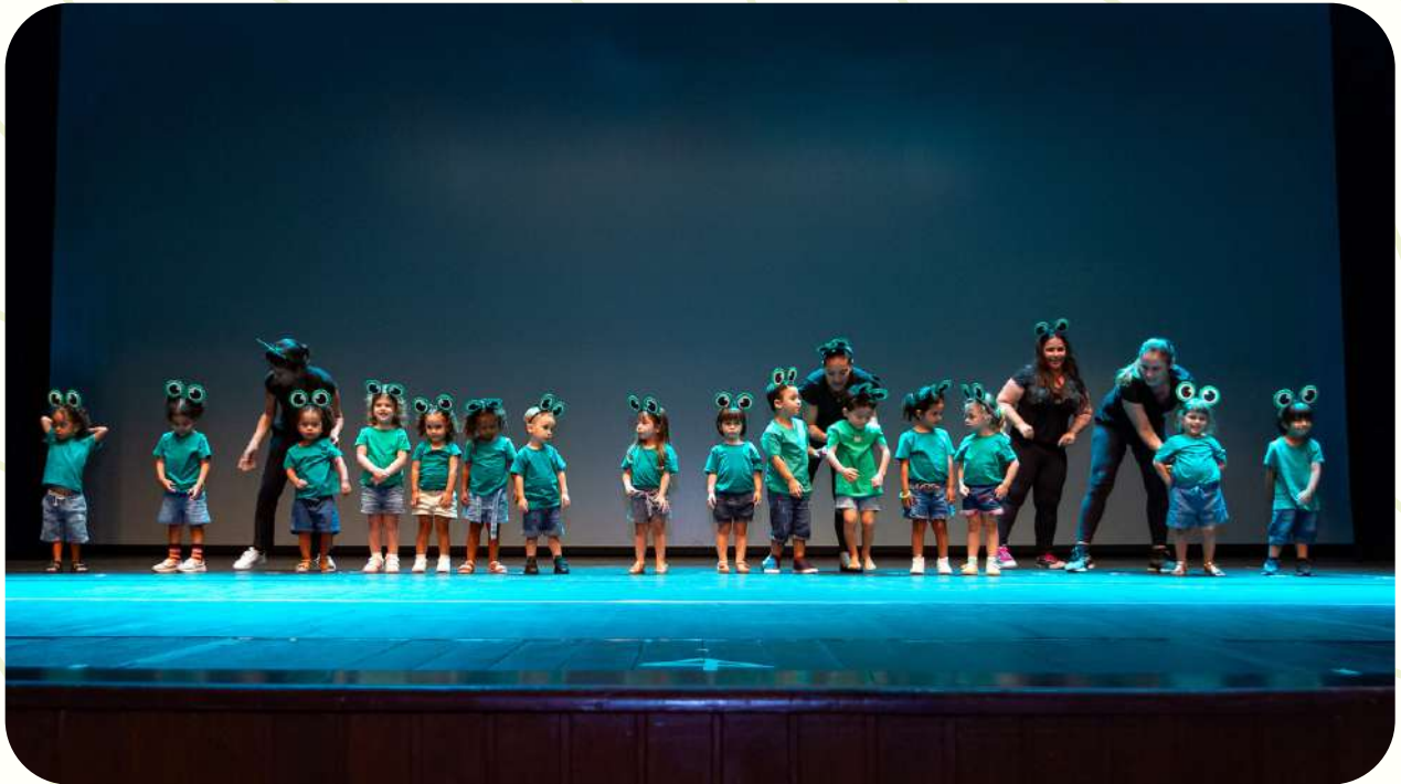
GRUPO 3 MATUTINO