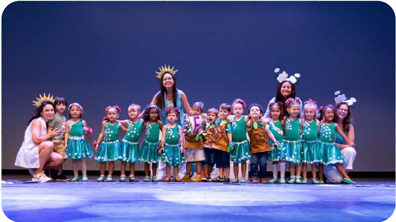
GRUPO 4 VESPERTINO