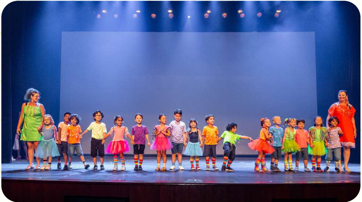
GRUPO 5 MATUTINO