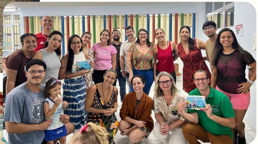
CONFRATERNIZAÇÃO DO DIA DOS SERVIDORES NO CAP CRIARTE UFES