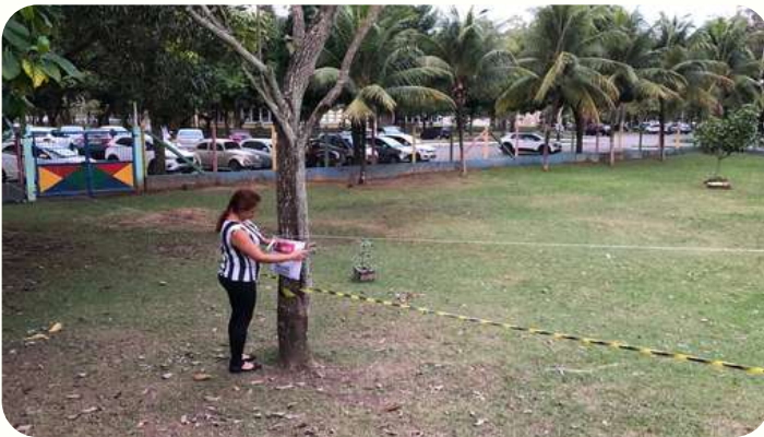
Isolamento da área em 16/08

No dia 16/08, quarta-feira, foi identificada uma colmeia de abelhas europeias (com ferrão) em uma árvore baixa no gramado frontal do CAP Criarte. Imediatamente a prefeitura de Vitória e o Corpo de Bombeiros foram acionados e a colmeia foi retirada pelos bombeiros no dia 17/08. Contudo, é comum que aconteça o retorno de algumas abelhas à área, o que demanda manutenção do isolamento da área. No dia 18/08, servidores da prefeitura municipal retornaram ao CAP, constataram a presença de algumas abelhas no local e se comprometeram a retornar na segunda-feira para continuar o monitoramento.