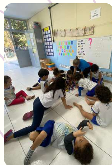
G5V - FAZENDO ATIVIDADE EM SALA DE AULA