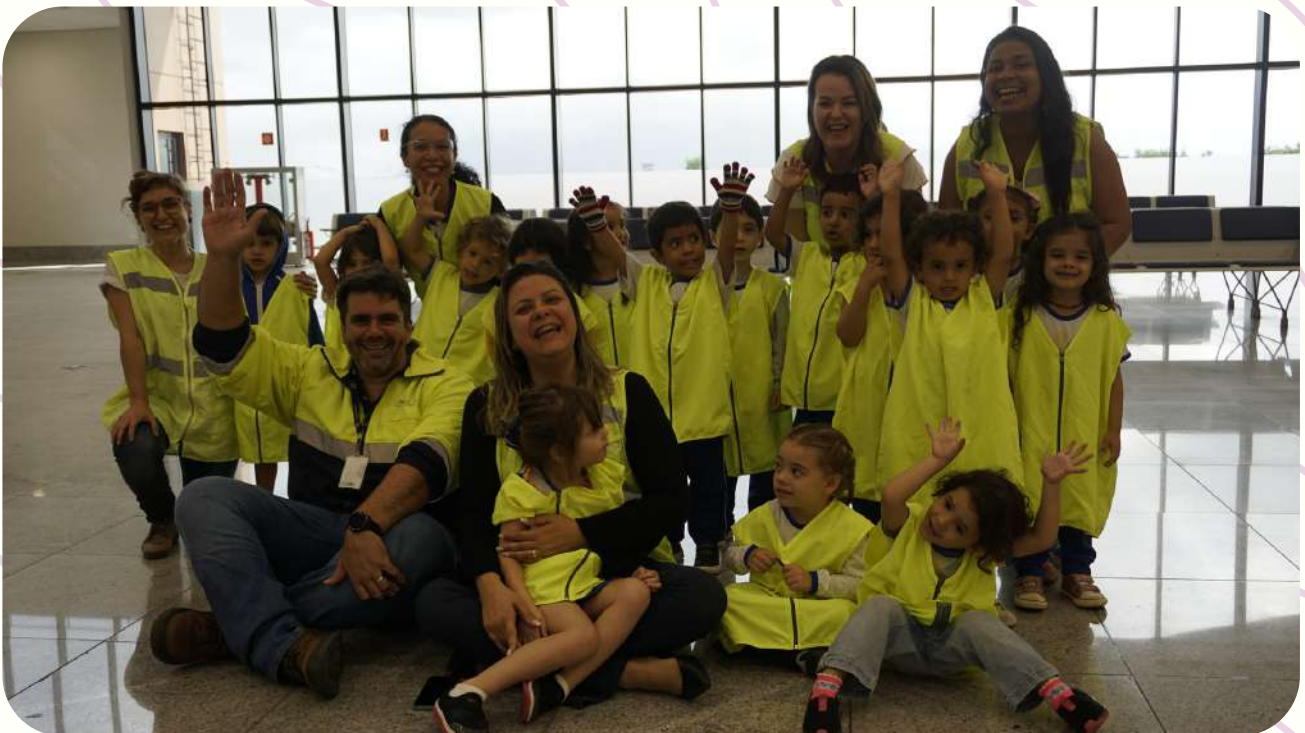
G3M - VISITA AO AEROPORTO DE VITÓRIA EM 16/08