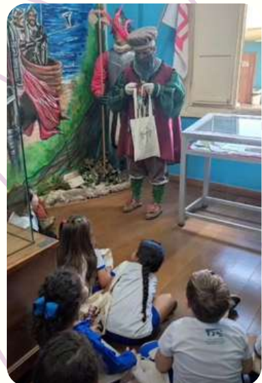
G5M - SÍTIO HISTÓRICO DA PRAINHA