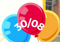
Cleidiane - Monitora G3M