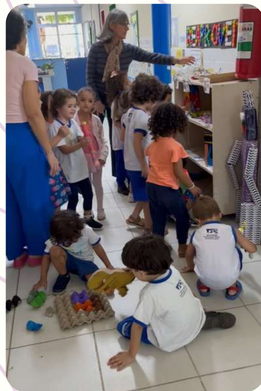
G3V - CRIANÇAS APRESENTAM PARA OS DEMAIS GRUPOS A EXPOSIÇÃO "TERRA, NOSSO MUNDINHO", QUE FAZ PARTE DO PROJETO "CONSTRUINDO SIGNIFICADOS SOBRE SI, O OUTRO E O MUNDO"