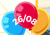
Bernadeth - Cozinha