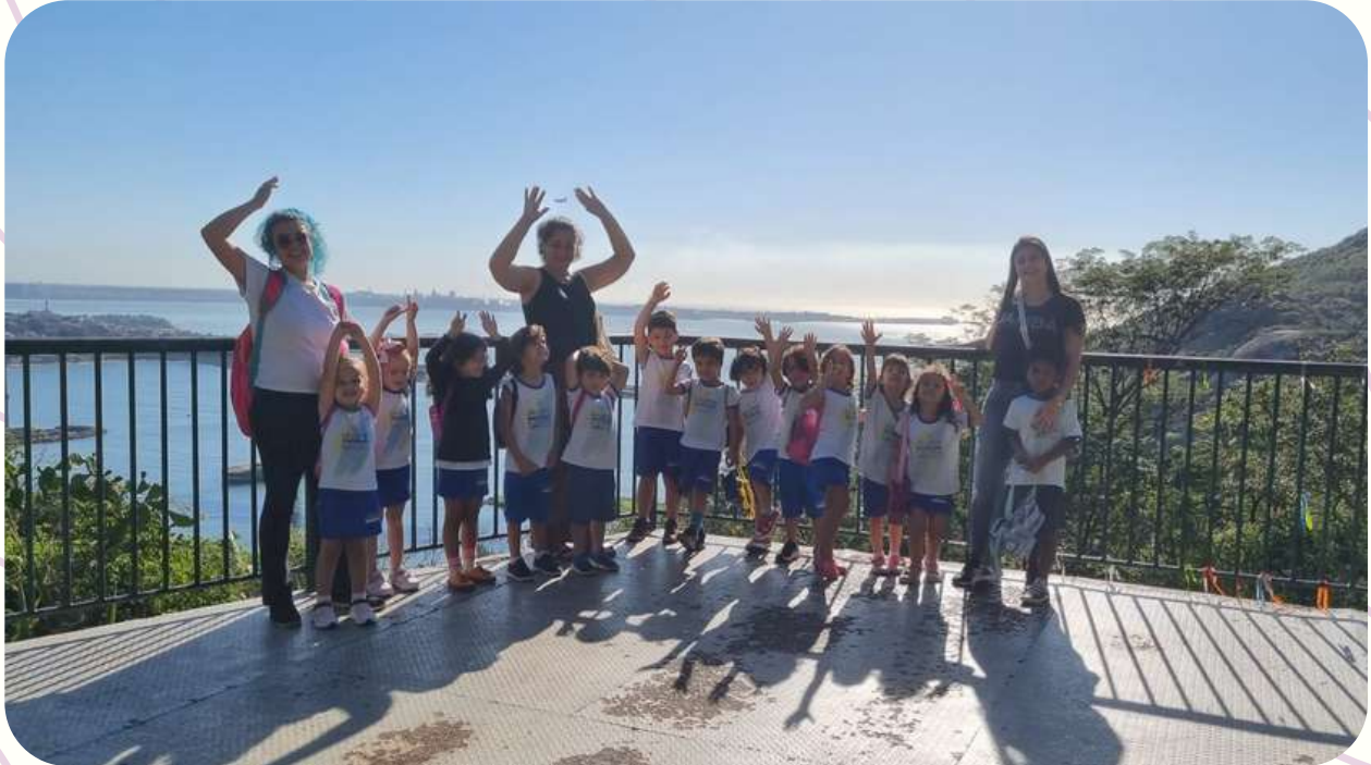
G4M - VISITA AO CONVENTO DA PENHA E IGREJA DO ROSÁRIO EM 08/08