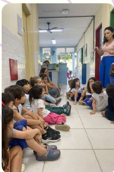
G4V - NA EXPOSIÇÃO DO G3V