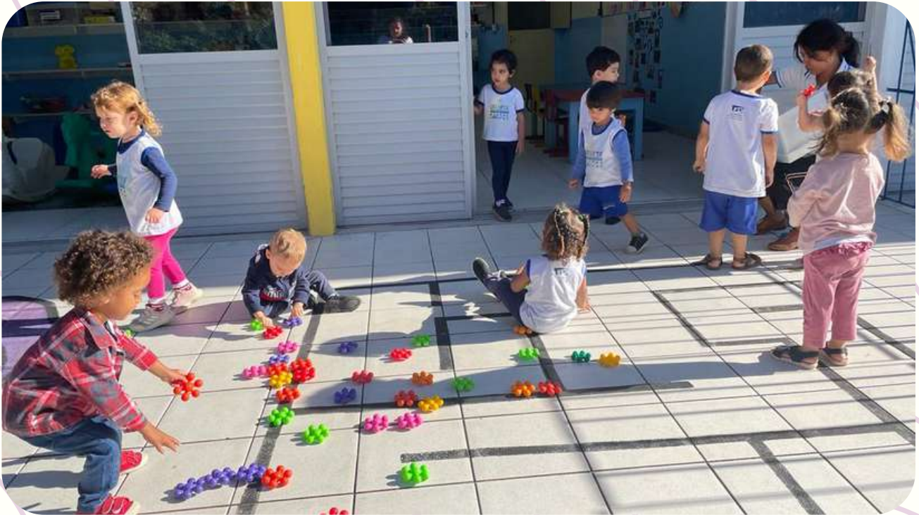
G2M - MOMENTOS DE BRINCADEIRAS NO SOLÁRIO