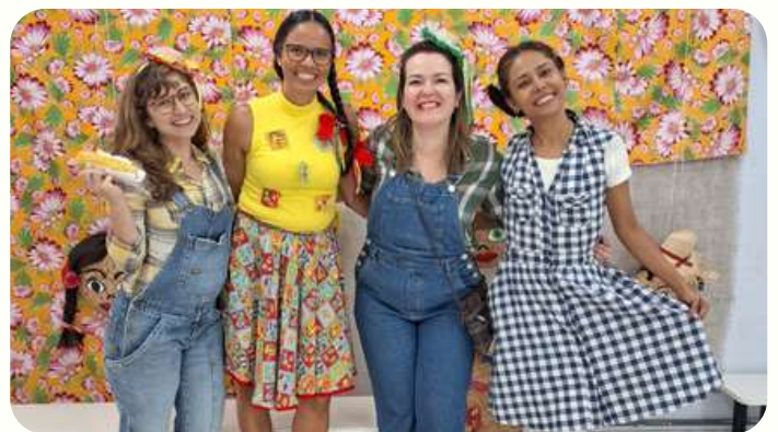
comidas típicas, como milho, canjiquinha, canjicão, valorizando importantes heranças das culinárias indígenas e africanas