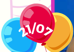
Aline - monitora G5V