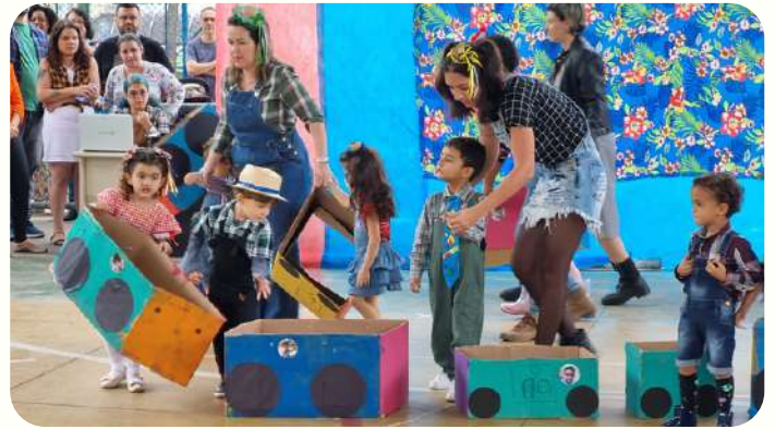
G3M - trens e ferrovias, com homenagem ao compositor Heitor Villa-Lobos