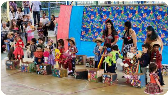
G4M - referência aos mamulengos - bonecos/fantoches presentes especialmente no estado de Pernambuco