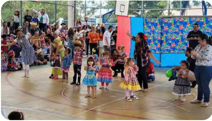
G2M - valorização da tradição oral com cantigas e parlendas

Ainda remetendo ao PPP, a festa cultural foi assim pensada: "acontece, preferencialmente, no meio do ano letivo e celebra a diversidade cultural brasileira e suas diferentes manifestações artísticas". Desse modo, nosso Arraiarte contou com marcas culturais como: