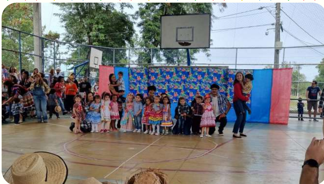
G3V - referência à musica sertaneja tradicional