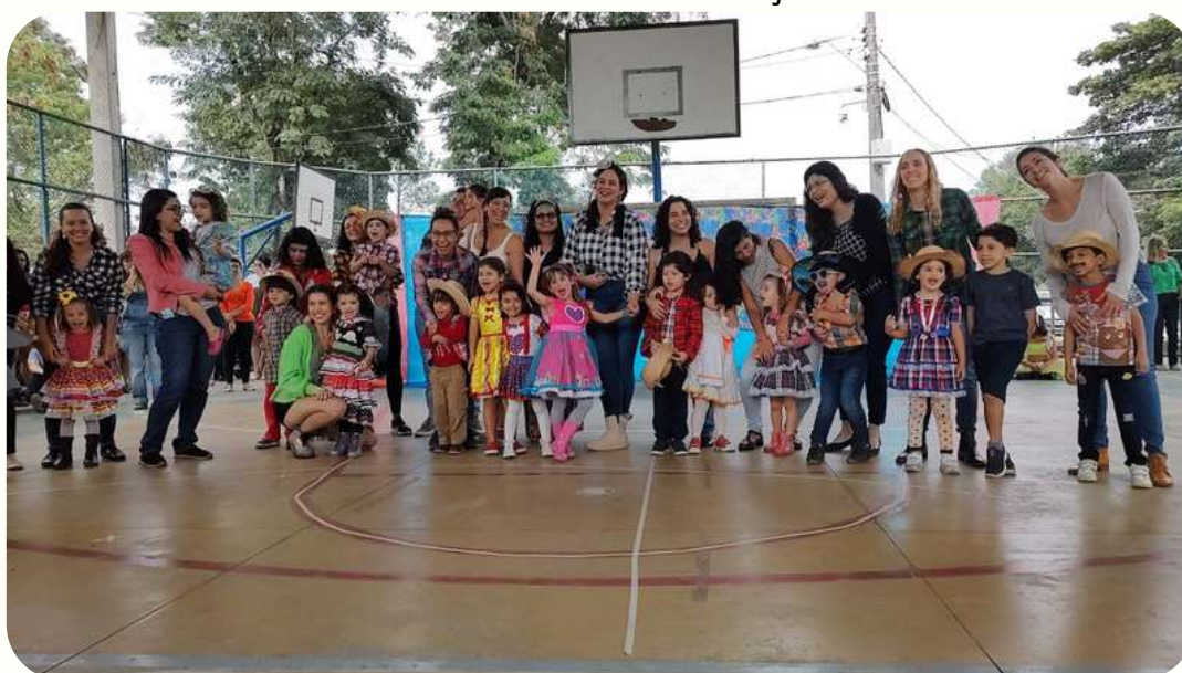
G4V - valorização do trabalho no campo