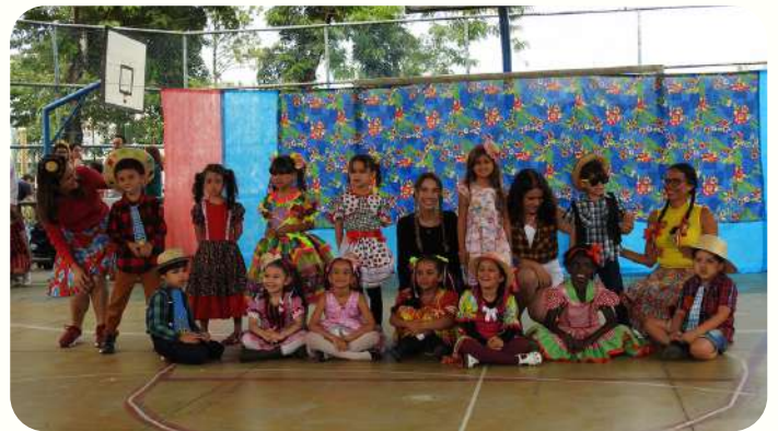
G5M - quadrilha