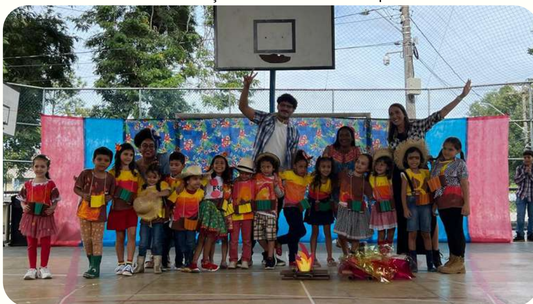
G5V - fogueira - tradição nos arraiais