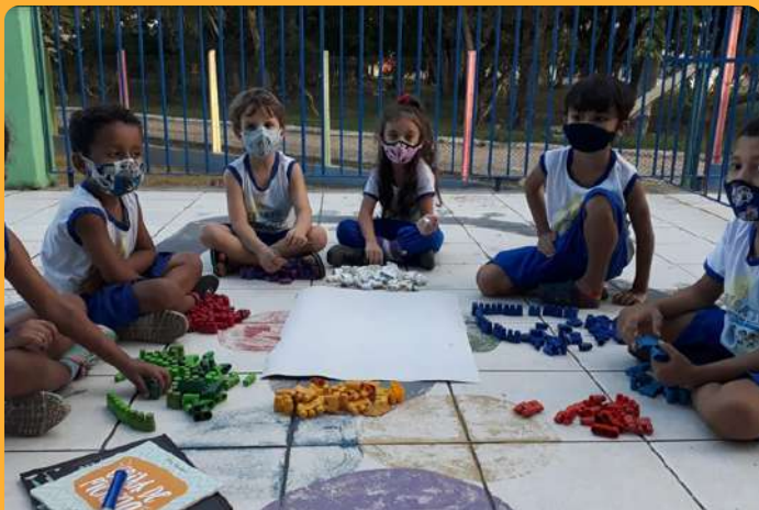
G5V - Atividade coletiva