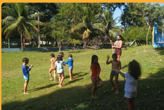
Despedida do verão - banho de mangueira do G5M (18/03/2022)