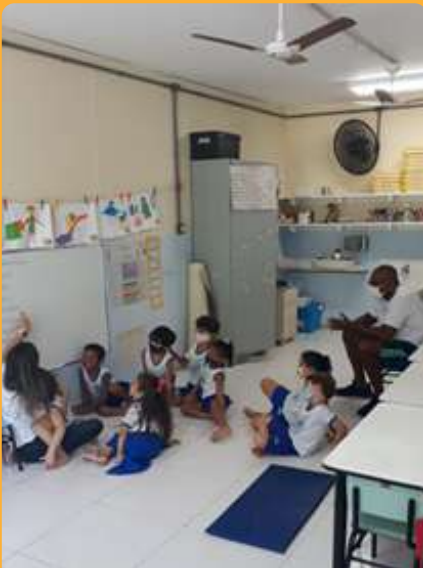
G5V - Momento da Roda