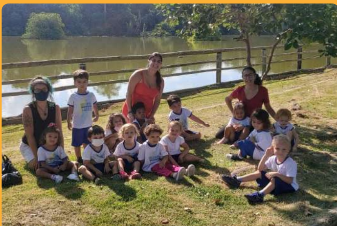
G3M - Passeio na lagoa da Ufes