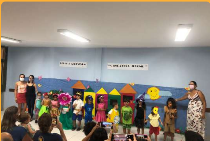
G4V - Apresentação Linda Rosa Juvenil

No Projeto Pró-Kids a proposta é a recuperação possível de práticas educativas e de interação que possibilitem a retomada, a adaptação e o desenvolvimento de habilidades físico, psicomotoras e cognitivas que permitam o nivelamento com a faixa etária e promova o combate ao sedentarismo infantil, conforme a promoção da qualidade de vida.