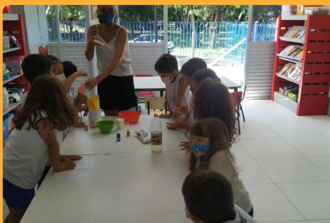
G5M - fazendo massinha e sentindo a textura dos ingredientes (25/03/2022)