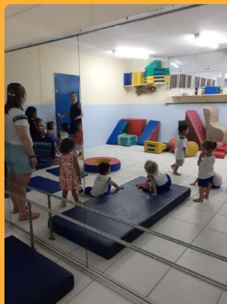
Educação Física- Conhecendo a sala de Educação Física