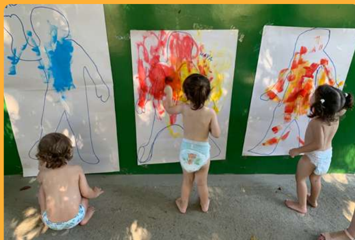
G2M - Pintura do contorno do corpo com tinta guache