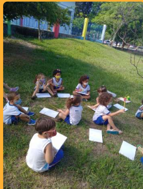
G4V - Fazendo arte no pátio