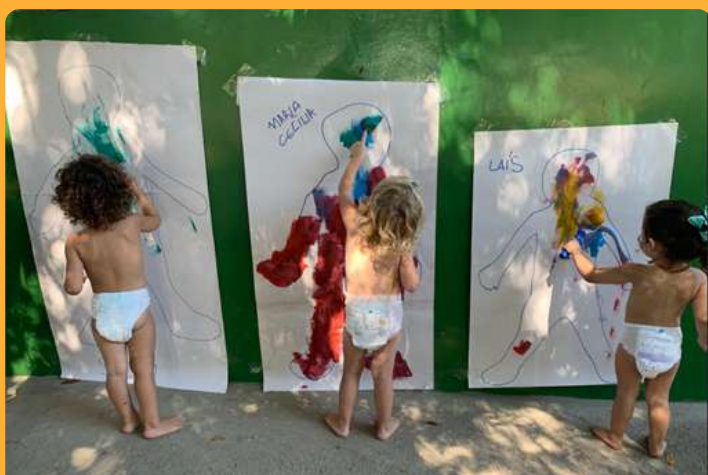
G2M - Pintura do contorno do corpo com tinta guache