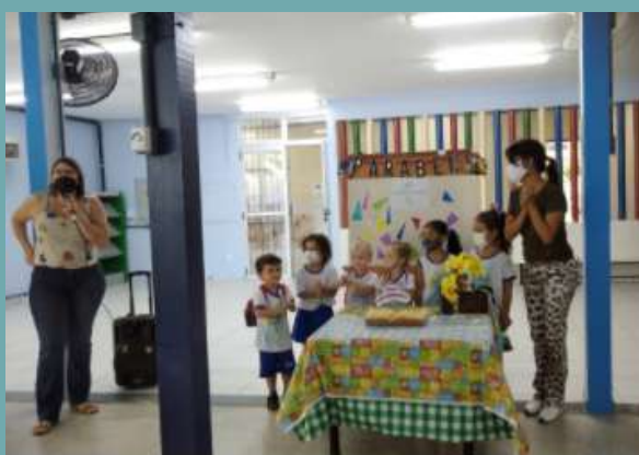
Comemoração no turno matutino

Toda última sexta-feira do mês o CEI comemora, na hora do lanche, os aniversariantes do mês. Em março, celebramos a vida dos nossos alunos e dos servidores nascidos em janeiro, fevereiro e março.