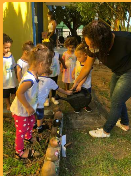
Projeto Literatura - Cuidando do boneco cabeça de alpiste