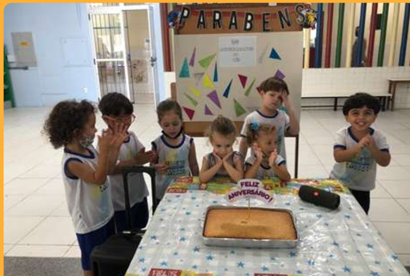
G3V - Comemoração coletiva dos aniversariantes de janeiro, fevereiro e março