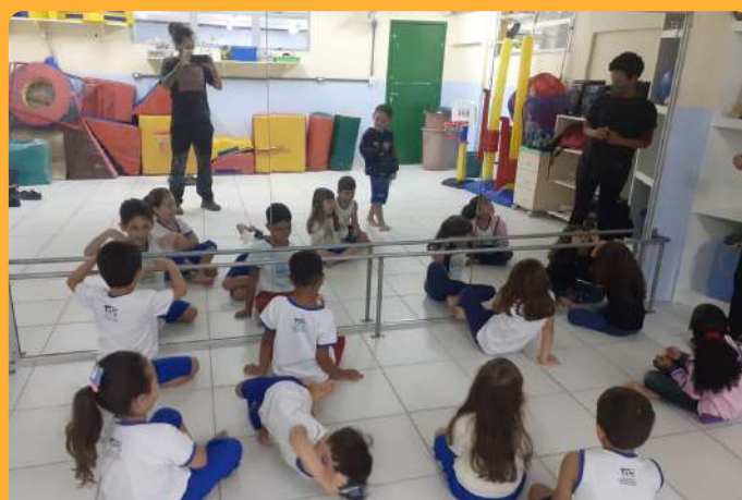
Educação Física - Reconhecendo expressões faciais: espelho, espelho meu, hoje me sinto...