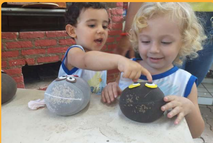
Projeto Literatura - Fazendo o boneco cabeça de alpiste