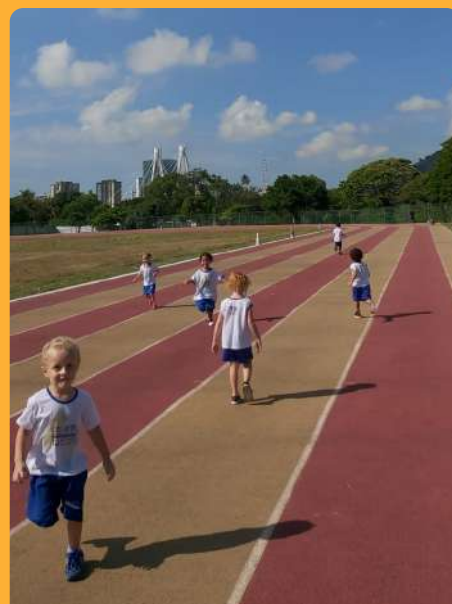
G3M - Pista de atletismo da Ufes