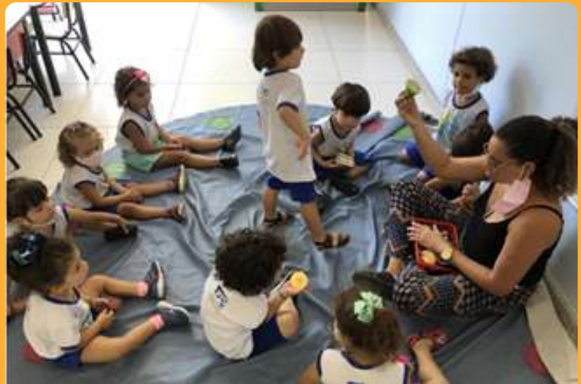
G3V - fazendo carimbo com verduras