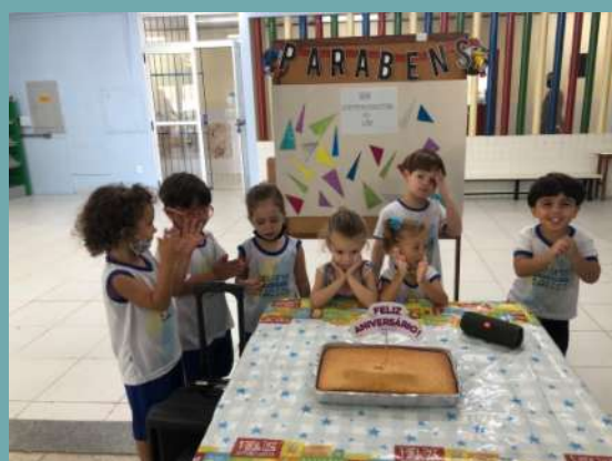
Comemoração no turno vespertino