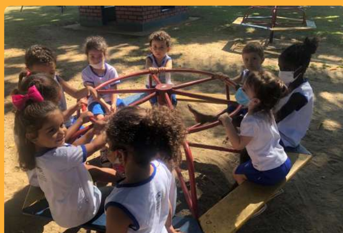
Momentos de interação entre grupos no pátio