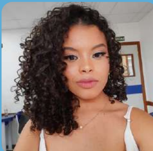
Daniely - Paepe Apoio Digital