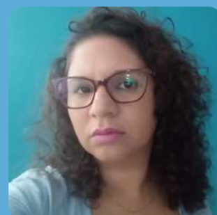
Eliandrea - G4M