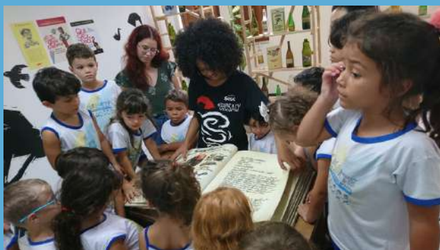
Visitação do Grupo 5 matutino à exposição #OcupaSacy, em 12/03

Vivências culturais, científicas e sociais diversificadas são fundamentais para o desenvolvimento infantil, promovendo desenvolvimento cognitivo, social e emocional. A exposição a diferentes culturas, tradições e perspectivas científicas desde cedo amplia o conhecimento, estimula a curiosidade e fortalece a empatia e o respeito pela diversidade.