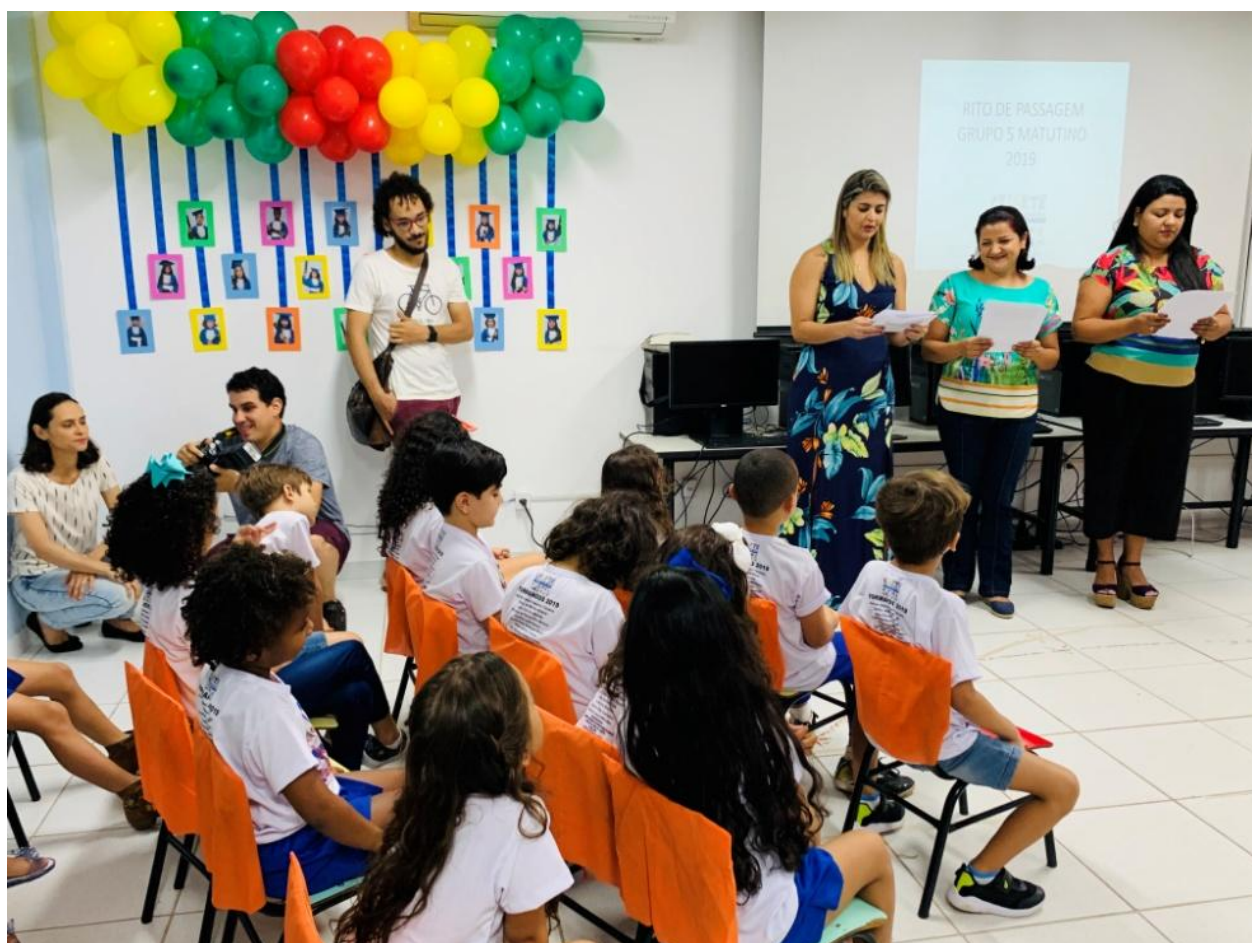
Rito de Passagem