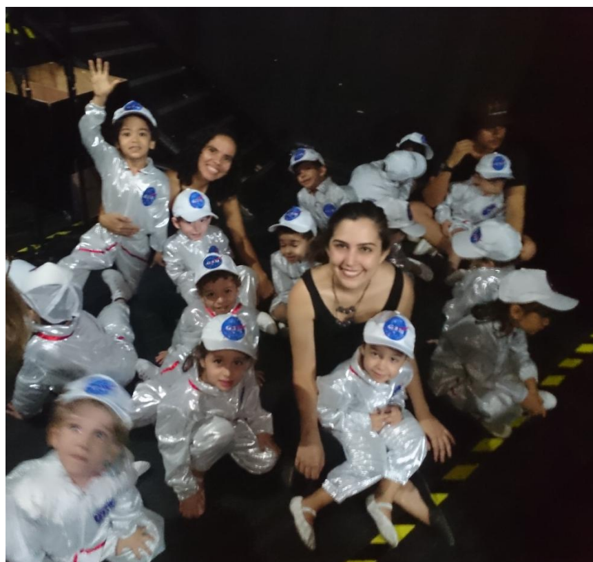
Bastidores da Festa de Encerramento