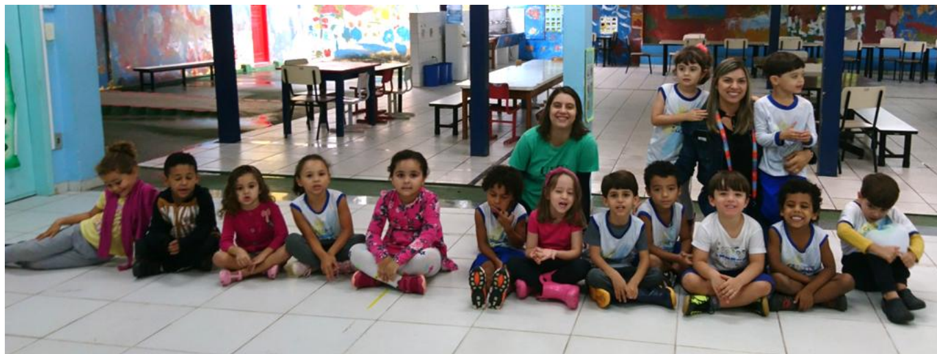
Ensaio geral para festa de encerramento