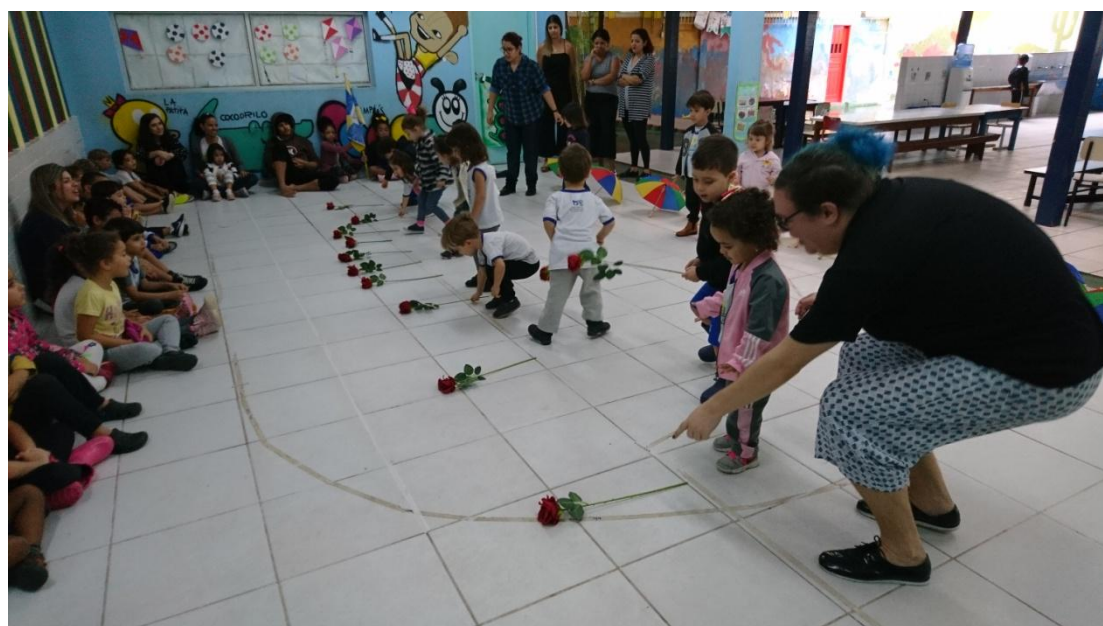
Ensaio geral para festa de encerramento