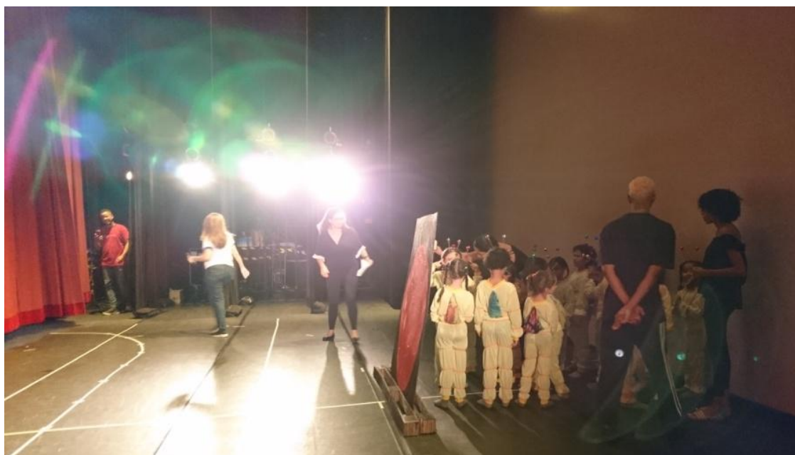
Bastidores da Festa de Encerramento