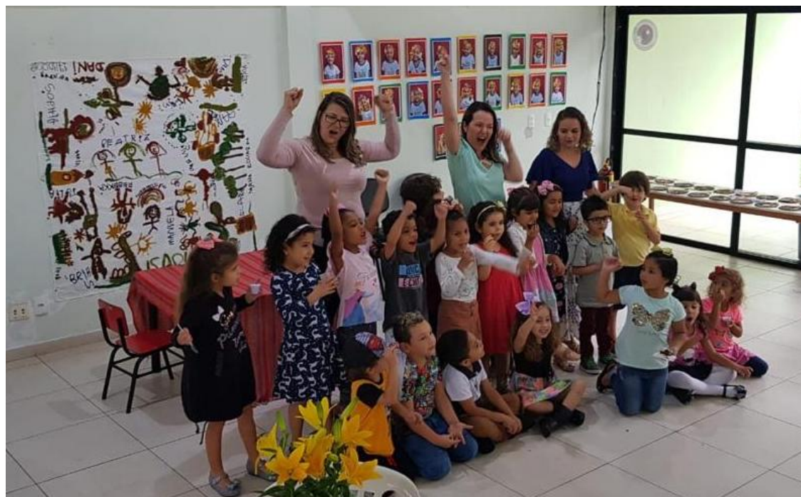
Lançamento do livro “Crianças que cozinham”