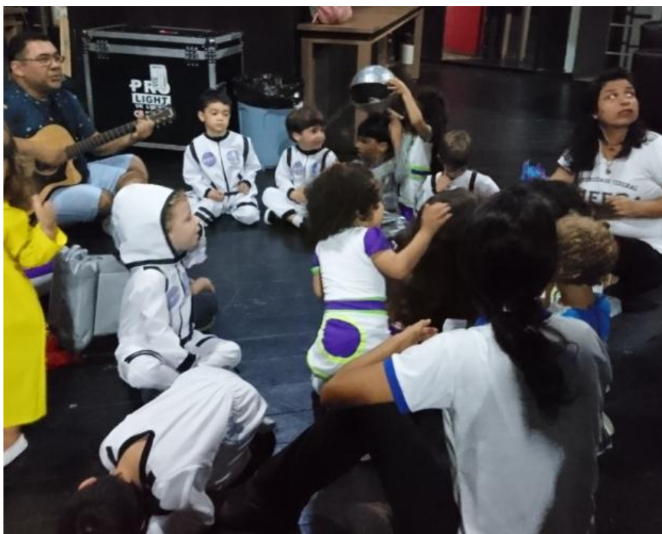
Bastidores da festa de encerramento