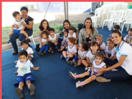
G2M na Feira Literária