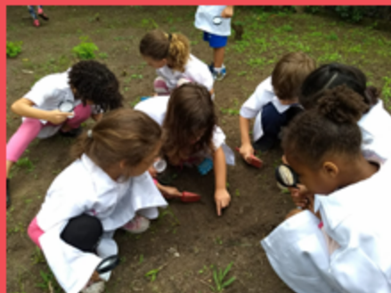
G4M coletando minhocas para o Minhocário