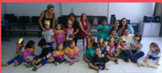
G3M - Apresentação Teatral A Linda Rosa Juvenil