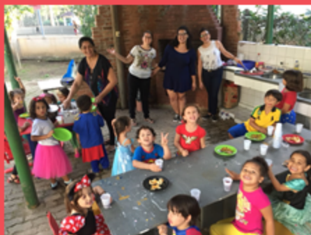
G4V - Churrasco da Turma