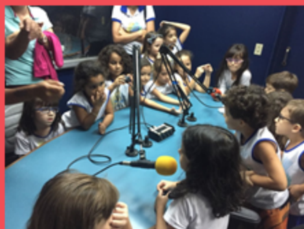
G5V - Visita à Rádio Universitária