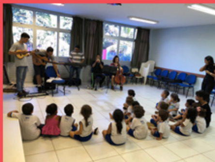
G3V - Oficina de Música