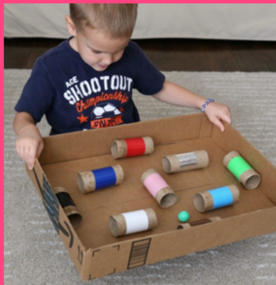
Pinball de papelão

Colocando cada ficha no buraco da cor correspondente