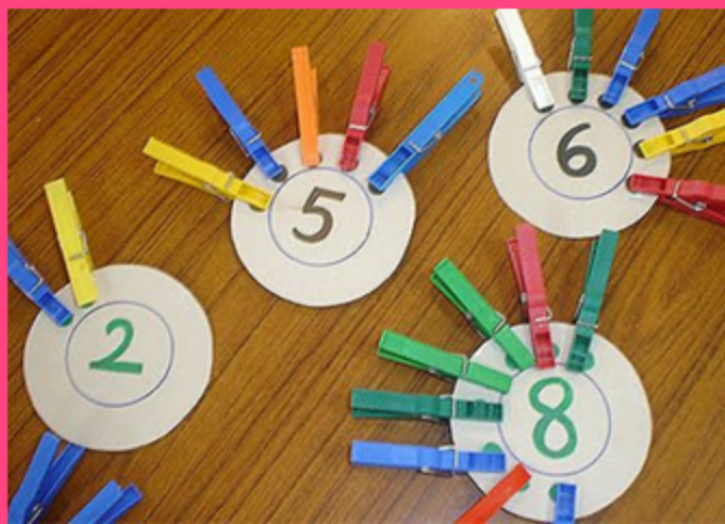
Brincando com pregadores