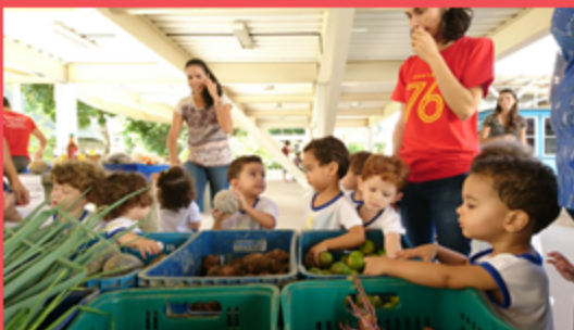
G2M - Visita à feira.