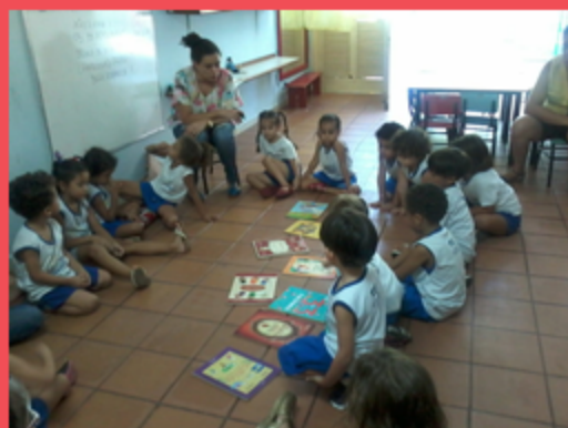
G4V - Votação do tema do projeto de sala.