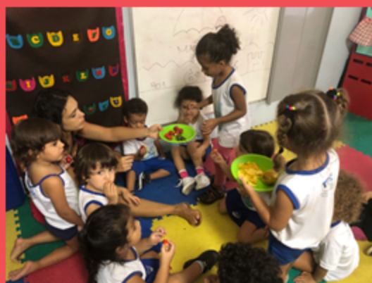
G3V - Dinâmica da fruta preferida.