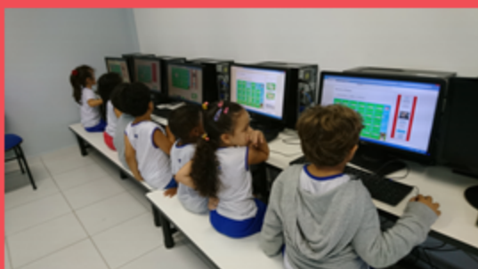
G5M - Atividade de informática.