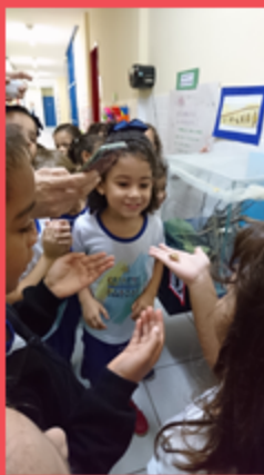
G4M- Acompanhando o ciclo da borboleta, o grupo 4 liberta a primeira mariposa que nasceu do casulo.