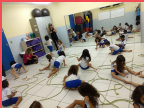
Educação Física - Projeto Jogos e brincadeiras.