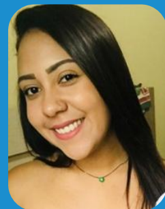
30/10 – Jayhane Educação Física – matutino