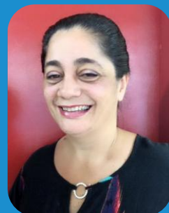
18/10 – Regina Auxiliar G5V