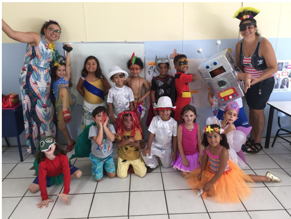
Bailinho a fantasia