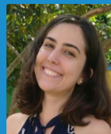
11/04 - Maria Auxiliar Grupo 3 Matutino