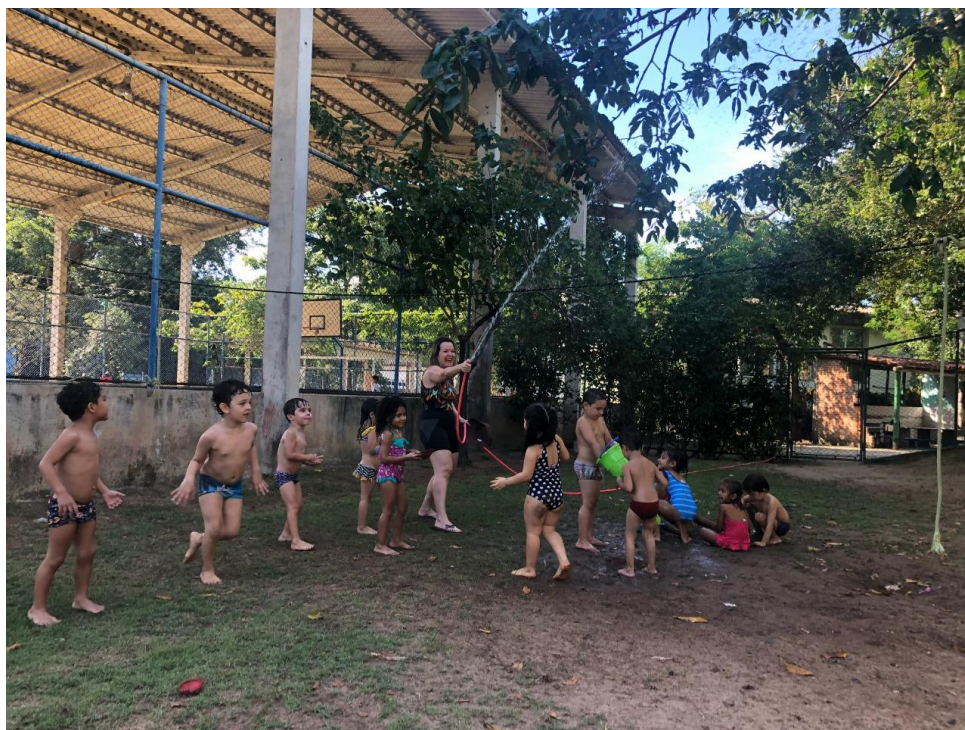
Banho de mangueira