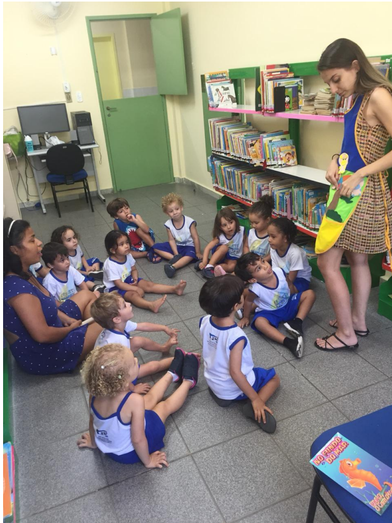
Conhecendo a biblioteca do Cei Criarte