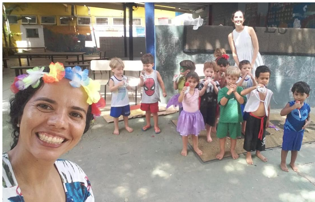
Chup-chup no dia do bailinho