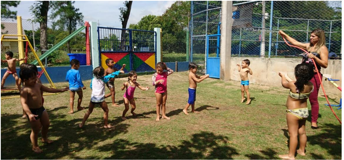
Banho de mangueira