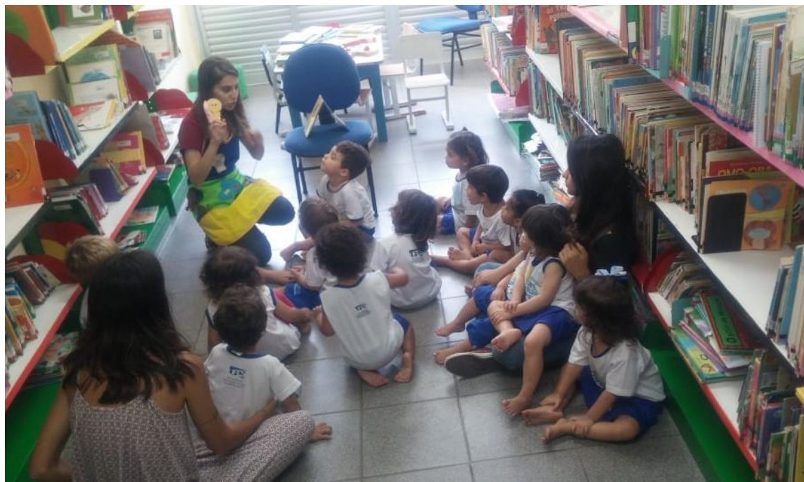
Conhecendo a biblioteca do Cei Criarte