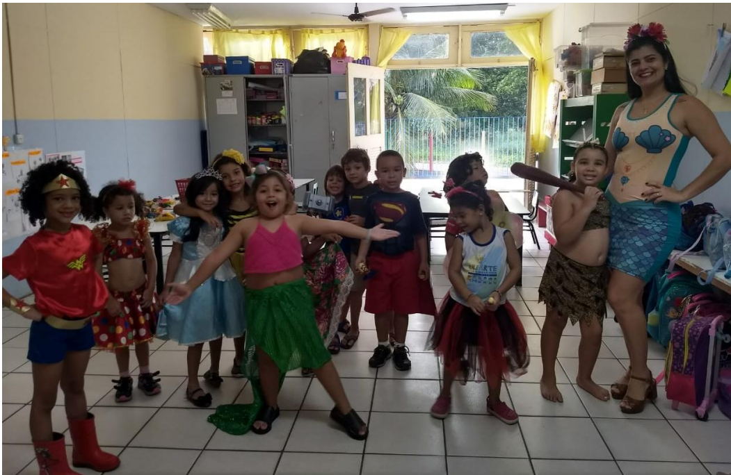
Bailinho a fantasia