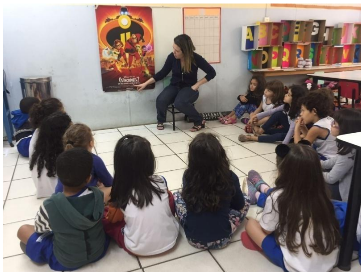
Explorando o gênero textual "Cartaz de Cinema"