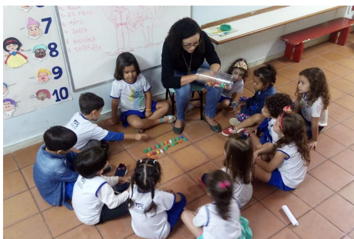
Brincando de estimativa