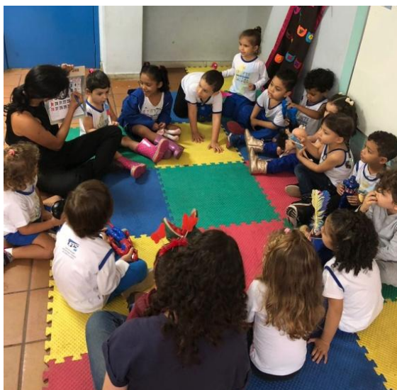
Inaugurando o Dia do Brinquedo