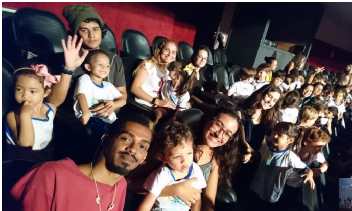
Teatro O Rei Leão