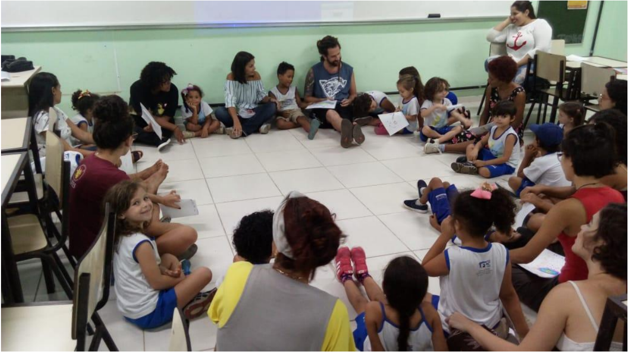
Participação especial na aula de desenho do curso de Artes Visuais