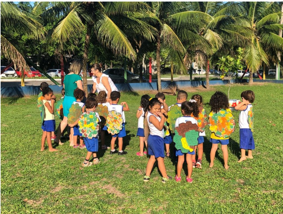
Brincando com cascos de tartaruga