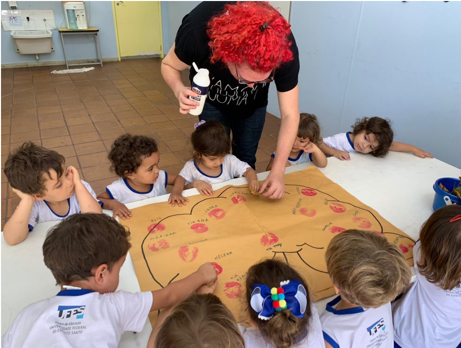
Cartaz a partir da história “A maçã que queria ser estrela”