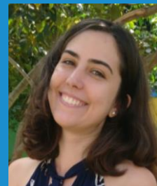
11/04 - Maria Auxiliar Grupo 3 Matutino