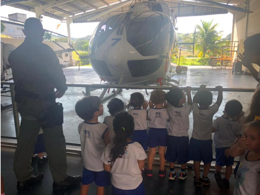
Visita ao Quartel da PM para conhecer um helicóptero